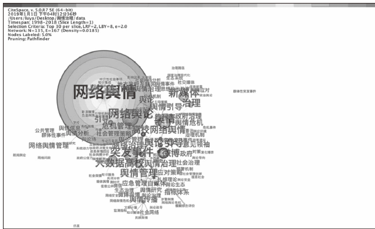
图 2 国内舆情治理研究关键词共现图谱

使用 CiteSpace 的关键词共现分析功能对 701 篇文献进行关键词共现，其他参数设置不变，将节点类型设置为“关键词”（Node Types = Keywords），设置阈值（Top N = 30），选取每一时间切片内出现频次排名前 30 的节点，网络裁剪参数设置为寻径网络（Pathfinder）和修剪合并后的网络（Pruning the Merged network），以方便降低网络密度，提高可读性。运行软件，得到节点数为 135、连线数为 167、密度为 0.0185 的舆情治理相关研究文献关键词共现知识图谱（见图 2）。